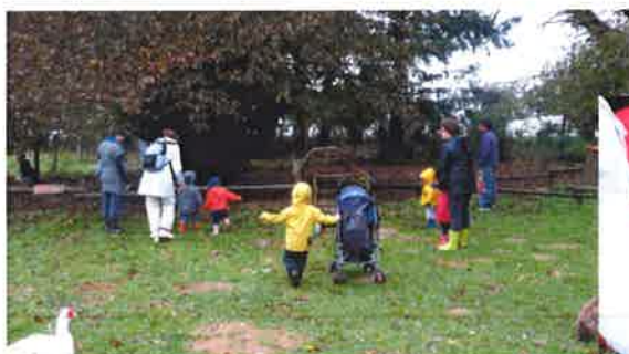
Sortie au Loup Garou