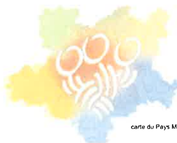
carte du Pays Mellois